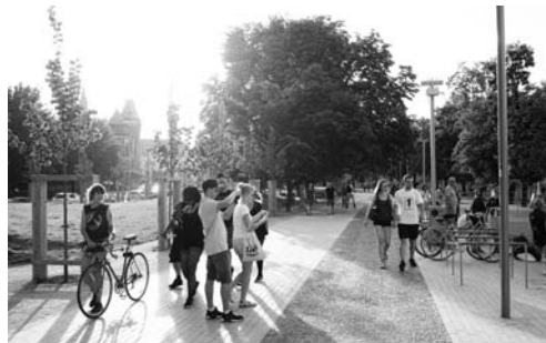
Fot. 3. Bulwar Xawerego Dunikowskiego to atrakcyjna i popularna przestrzeń publiczna

przestrzenie rekreacyjne, zbudowano amfiteatr nad rzeką z nabrzeżem cumowniczym dla małych jednostek pływających, przystań statków spacerowych oraz kładkę pieszko-rowerową pod Mostem Pokoju łączącą części bulwaru. Nadrzędną ideą projektu było fakt, że (...) sposób zagospodarowania bulwaru ma umożliwić jak najbliższy kontakt użytkowników z rzeką i widokami przeciwległego brzegu. W tym celu na całej długości bulwaru zastosowano szereg form różnicujących poziomy, dopasowanych do kształtu linii brzegowej rzeki 8 . Rozwiązania projektowe są spójne z charakterem historycznego centrum miasta oraz z samym korytem rzeki Odry, które jest regulowane i posiada (...) ceramiczne konstrukcje murowe na zaprawie cementowo-wapiennej lub w formie betonowych konstrukcji z okładziną ceramiczną (...) [Klin, Idzikowski 2008:28-29]. Bulwary są bardzo popularnym i lubianym miejscem spotkań mieszkańców i turystów, a przestrzeń ta umożliwia różne formy rekreacji. Z poziomu bulwarów otwierają się widoki na Ostrów Tumski – najstarszą, zabytkową część Wrocławia.