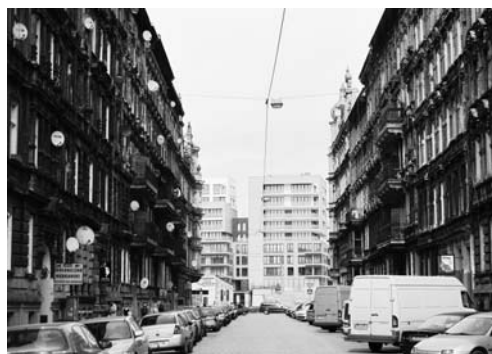
Fot. 7. W zabytkowym układzie urbanistycznym powstaje również nowa zabudowa