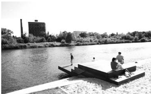
Fot. 2. Bulwary Politechniki Wrocławskiej mają charakter sportowo-rekreacyjny