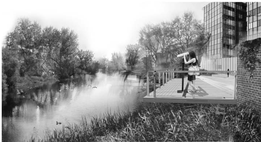
Fot. 10. Wizualizacja strefy wejściowej od strony mostu Oławskiego