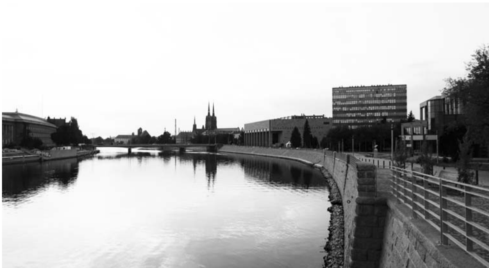
Fot. 1. W ścisłym centrum miasta przestrzenie nadrzeczne mają historyczny i wielkomięjski charakter