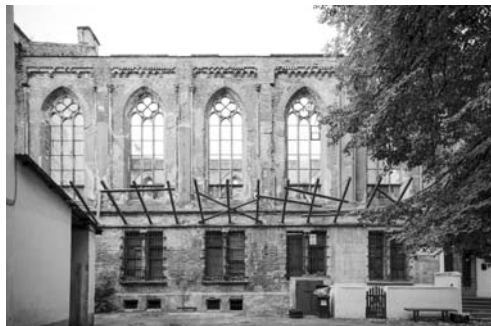
Fot. 12. Ruina kaplicy przy kompleksie szpitala Bethanien, tzw. Kościół Chrystusowy

samodzielnego zdefiniowania zakresu i priorytetów swojej pracy. Szeroka paleta rozwiązań zaproponowana zarówno przez profesjonalistów, jak i studentów zaprezentowana została w trakcie wystawy towarzyszącej Dolnośląskiemu Festiwalowi Architektury – DoFA'17. Obecnie Biuro Rozwoju Wrocławia prowadzi prace nad aktualizacją miejscowego planu zagospodarowania przestrzennego.