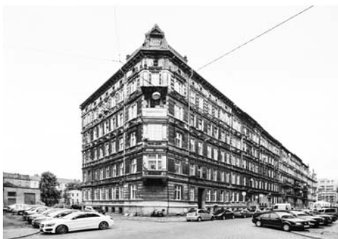
Fot. 6. Kwartałowa zabudowa Przedmieścia Oławskiego

Dzięki przeprowadzeniu wielu analiz możliwe było wyłonienie priorytetowych obszarów interwencji, którymi są: zdegradowane wnętrza podwórzowe, pustostany w parterach, infrastruktura społeczna służąca mieszkańcom, jakość otoczenia mieszka-