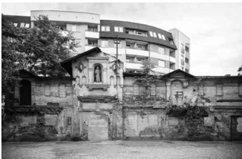
Fot. 11. Ruina dawnej fabryki wódek i likierów Carla Schirdewana