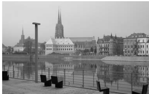
Fot. 5. Z bulwaru Xawerego Dunikowskiego otwierają się widoki na Ostrów Tumski – najstarszą, zabytkową część Wrocławia

m.in. rozwój transportu rzeczno 10 , rewitalizację i renaturalizację rzek 11 , ochronę terenów przyrodniczo cennych 12 , wzmacnianie rekreacyjnej oraz kulturowej funkcji rzek 13 , kompleksowe zagospodarowanie Odry i jej głównych dopływów uwzględniając jej potencjał ekonomiczny 14 , wspieranie rekreacji pieszej, rowerowej i wodnej na terenie Aglomeracji Wrocławskiej 15 . Również Studium Uwarunkowań i Kierunków Zagospodarowania Przestrzennego 16 poświęca uwagę rozwojowi rzek w strukturze Wrocławia. W części dotyczącej kierunków zagospodarowania przestrzennego sformułowana została polityka rzeczna, w której zdefiniowane zostały docelowe profile rzek (m.in. rzeka Oława została określona jako sportowo-rekreacyjna), sektory funkcjonalne rzek (w podziale na wielofunkcyjny, mieszkaniowy, kulturowy, aktywności gospodarczej, sportowo-rekreacyjny, przyrodniczy, agrarny).