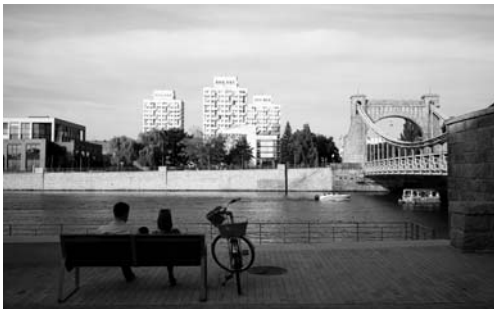
Fot. 4. Bulwar Xawerego Dunikowskiego – widok na zespół mieszkalno-usługowy przy placu Grunwaldzkim oraz most Grunwaldzki