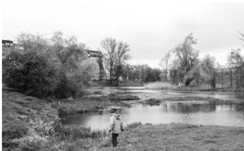
Fot. 8. Rzeka Oława posiada duże walory rekreacyjne