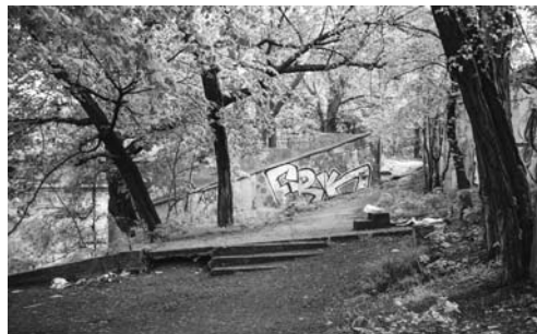
Fot. 9. Zdegradowane tereny wzdłuż nabrzeży są trudno dostępne dla mieszkańców

niezwykle cenna wartość, wobec czego ważne jest ułatwienie dostępu do tych terenów dla mieszkańców Przedmieścia Oławskiego i Wrocławia w sposób zapewniający poszanowanie tego miejsca (fot. 6 i 7).