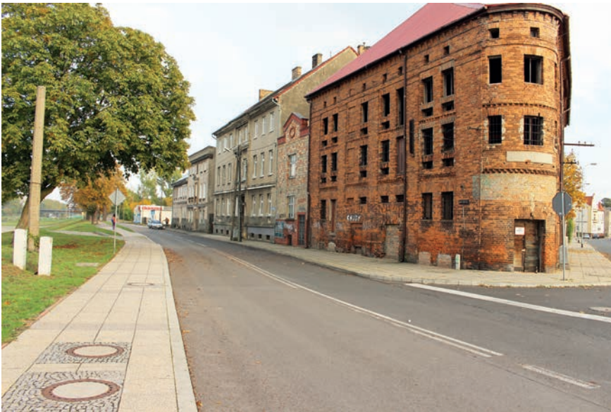
IL. 4 Fragment rysunku miejscowego planu oraz widok istniejącej przestrzeni na części terenu elementarnego MW/U 1, U 1, MW/U 6. Gorzów WLKP

Ill. 4 Part of the local plan design and view of existing space on a part of elementary area MW/U 1, U 1, MW/U 6, ZZ 1. Gorzów WLKP. Źródło/Source: fot. Tomasz Żyliński, rysunek zmiany miejscowego planu/design changes of the local plan: http://bip.wrota.lubuskie.pl/umgorzow/system/obj/594_48_rys_mpzp_zielona_grobla.pdf