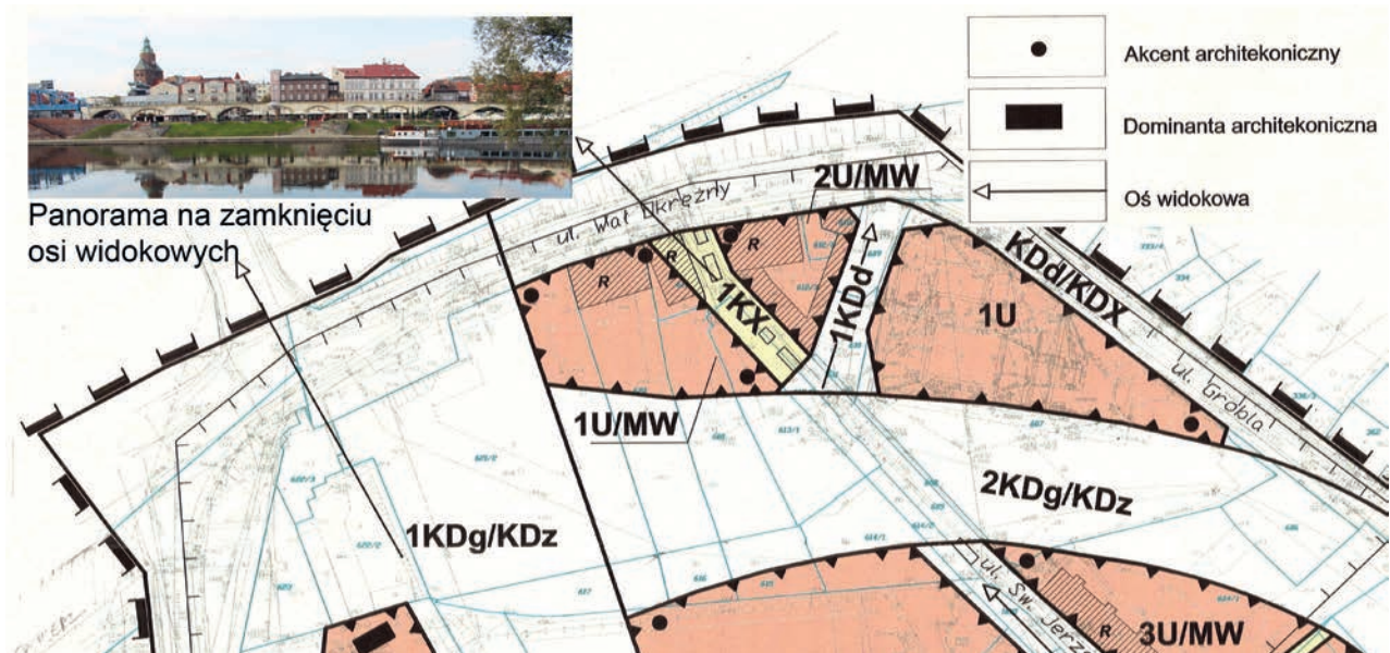
II. 3 Fragment rysunku miejscowego planu zagospodarowania przestrzennego. Gorzów WLKP

III. 2 Part of local land development plan.